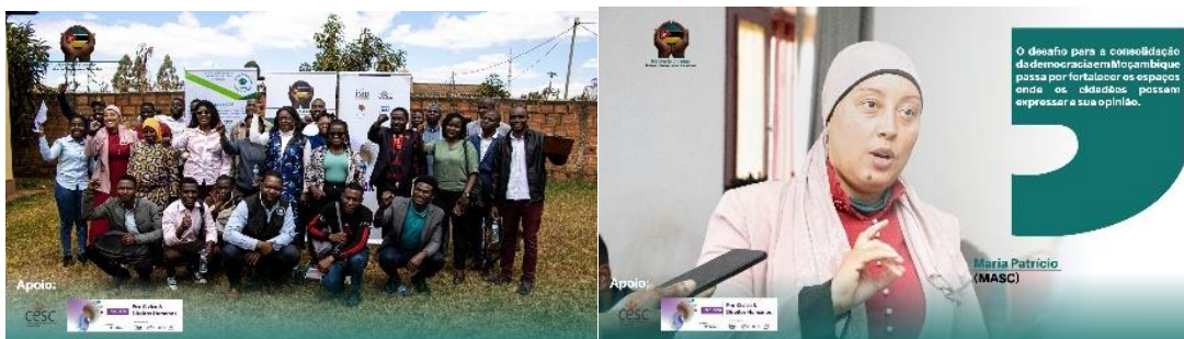
Imagens I- sessão de Oficina de Ideias em Lichinga