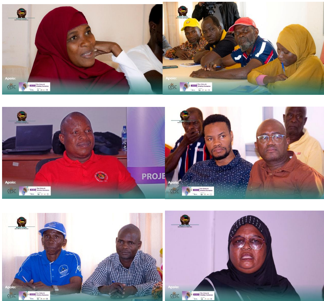
Imagens VI- Sessão de Conselho e Café Cidadão em Moimim

As autoridades solicitaram, ainda, apoio do Manifesto Cidadão para assegurar que essas preocupações sejam efectivamente encaminhadas e consideradas ao mais alto nível.