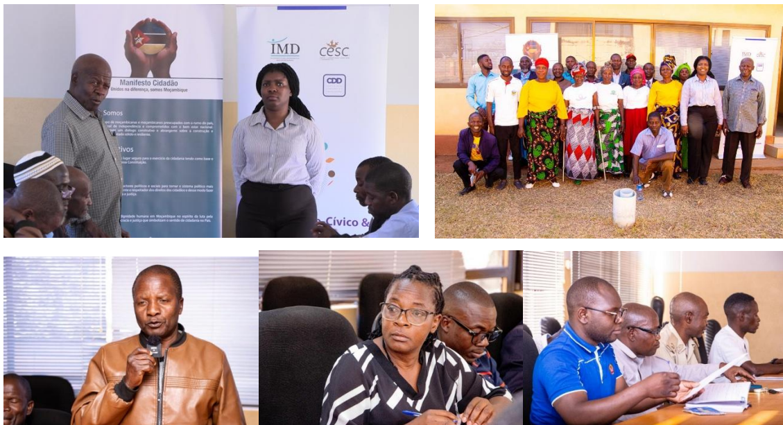
Imagens VIII- Sessão de Conselho e Café Cidadão Marrupa