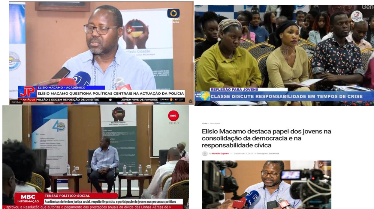
Imagens X- Recortes na Imprensa