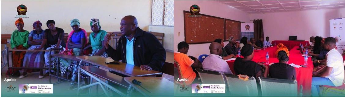
Imagens VII Sessão de Conselho e Café Cidadão Monapo