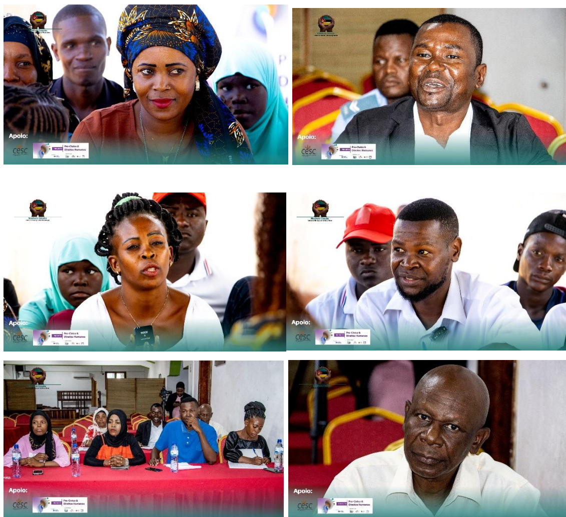
Imagens V- Sessão de Conselho e Café Cidadão em Angoche