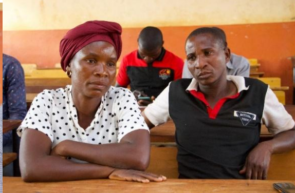
Imagens IX- Sessão do Conselho Cidadão em Sanga