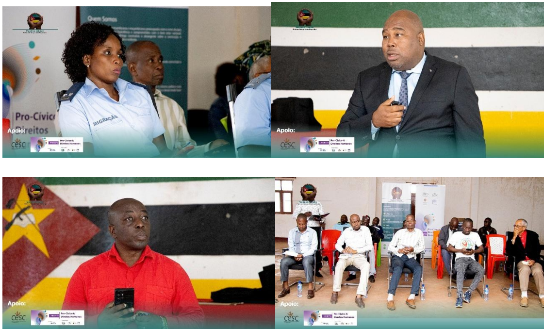
Imagens III- Sessão de Conselho e Café Cidadão em Mandimba