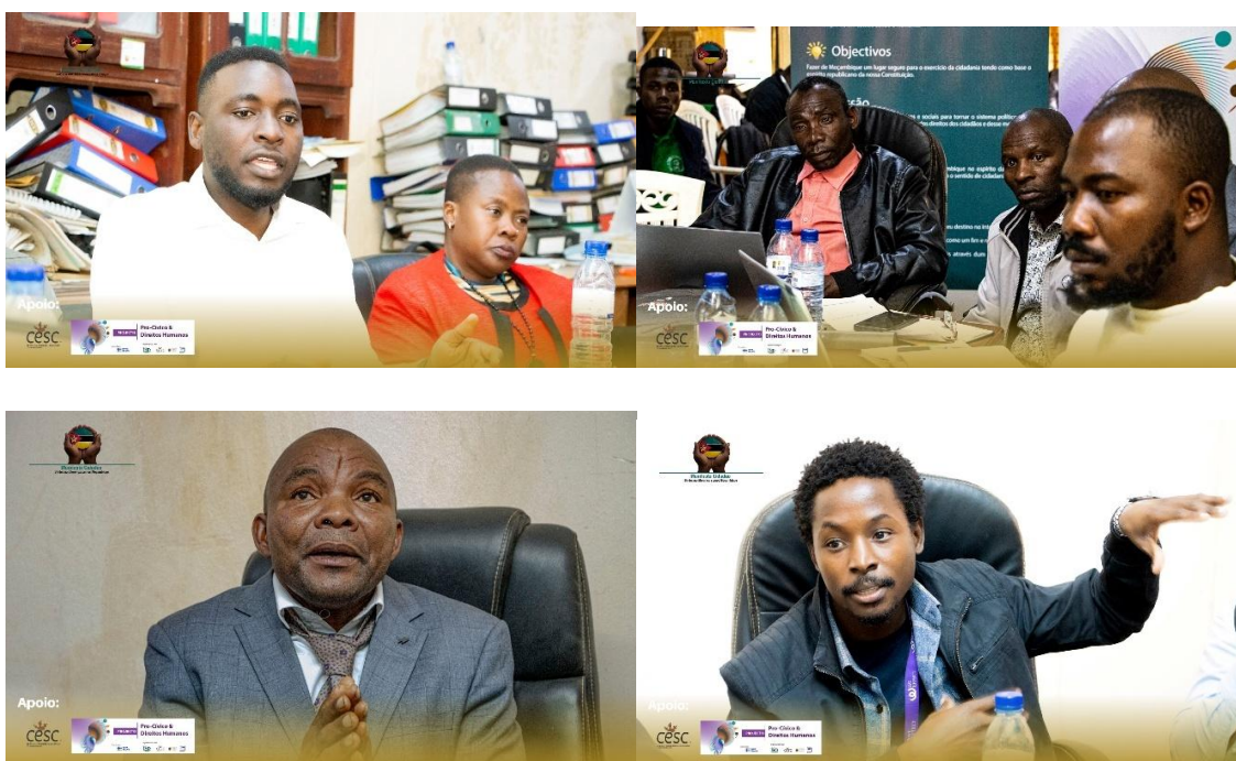
Imagens II- sessão de Terreno Comum na sala do conselho Islâmico de Moçambique em Lichinga

d) Recomendações: Apesar de existir terreno comum de maior participação das comunidades na elaboração das legislações. Ainda deve se debater a questão da participação dos cidadãos na tomada de decisão, se as formas consagradas no nosso ordenamento jurídico conseguem abarcar os principais interesses dos intervenientes que são os camponeses ou exclui uma gama dos benefícios comuns. Mas também a questão de posse da terra deve merecer também um aprofundamento em debates públicos.