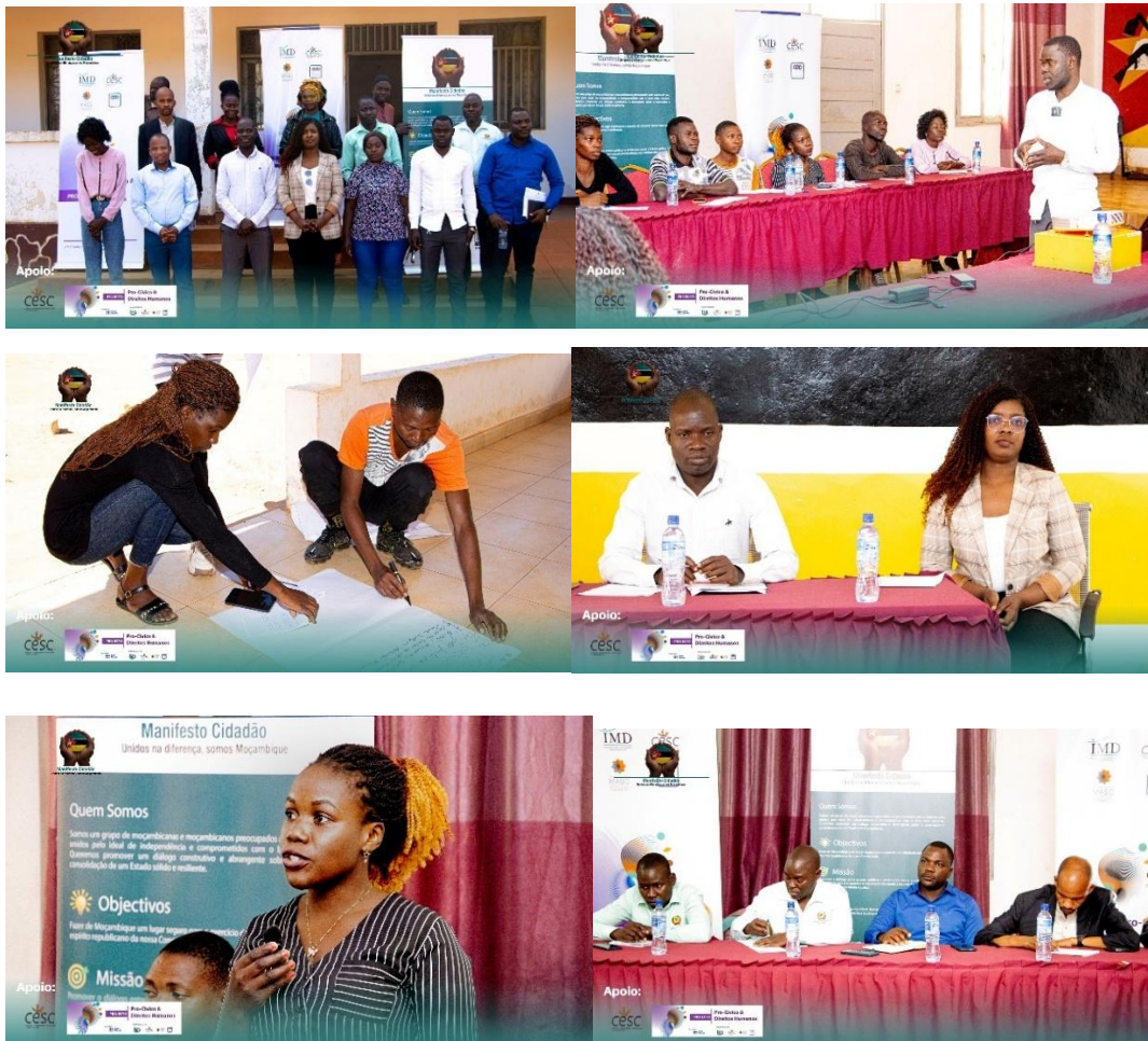
Imagens IV- Sessão de Conselho e Café Cidadão em Nipepe